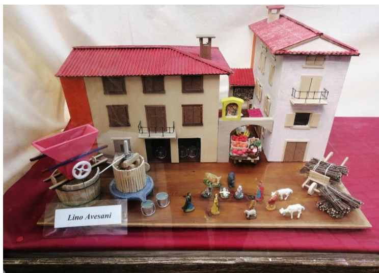
Lino Avesani Premio "Composizione"