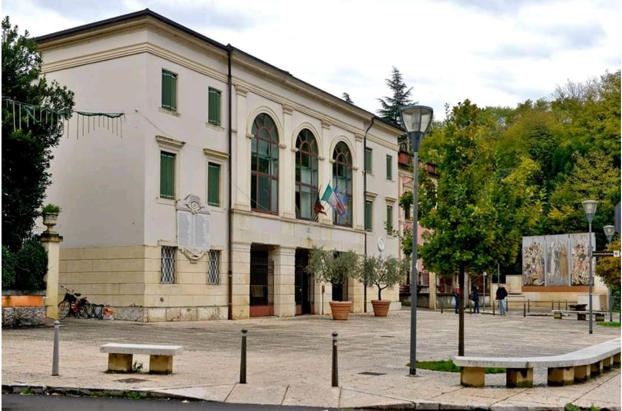
La Sede della 2 a Circoscrizione in Piazza Angelo Rigetti, 1 – 37125 Quinzano Verona