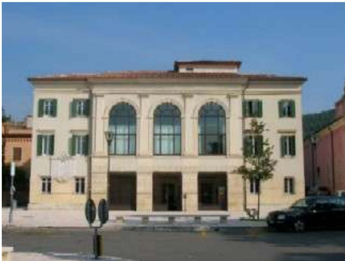
La Sede della 2^ Circoscrizione in Piazza Angelo Rigetti, 1 – 37125 Quinzano Verona